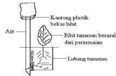
Gambar 3.1. Penanaman dengan menggunakan bibit

Saat penanaman sebaiknya polybag jangan dilepas, tetapi hanya dirobek bagian bawahnya saja supaya media tanam yang berupa lumpur tidak terlepas. Adapun contoh penanaman seperti gambar berikut 3.1: