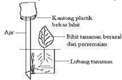
Gambar 3.1. Penanaman dengan menggunakan bibit

Saat penanaman sebaiknya polybag jangan dilepas, tetapi hanya dirobek bagian bawahnya saja supaya media tanam yang berupa lumpur tidak terlepas. Adapun contoh penanaman seperti gambar berikut 3.1: